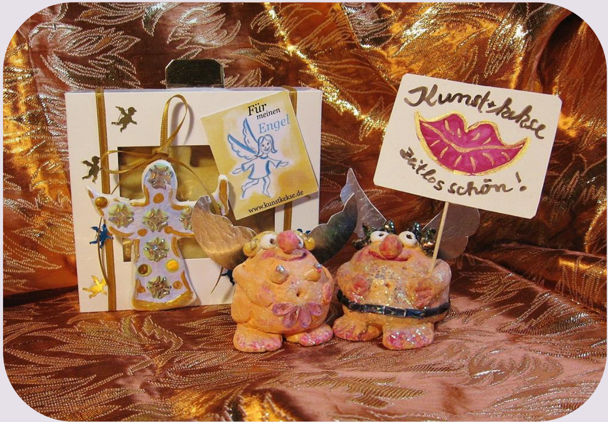
Die neuen Engelkekse bei Kunstkekse, zum Dekorieren und Vernaschen!